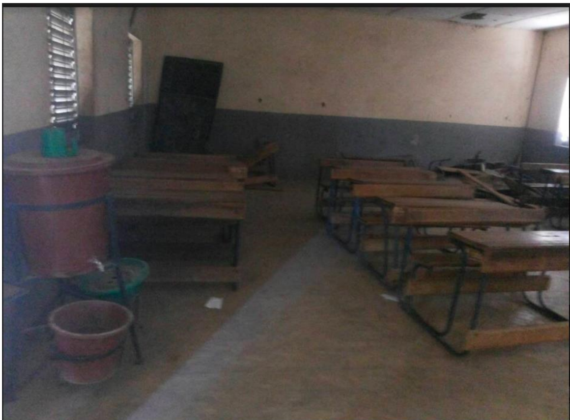
Figure 3 : Image de tables-blancs endommagées