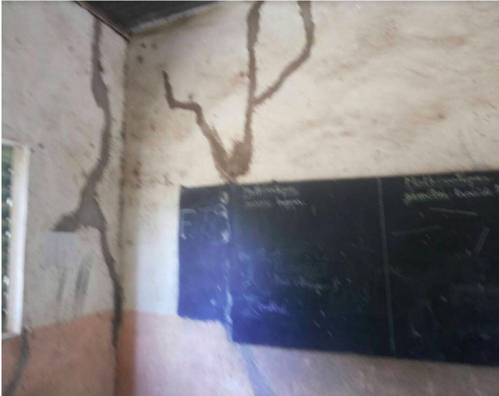
Figure 4 : Travaux de rénovation de murs nécessaire