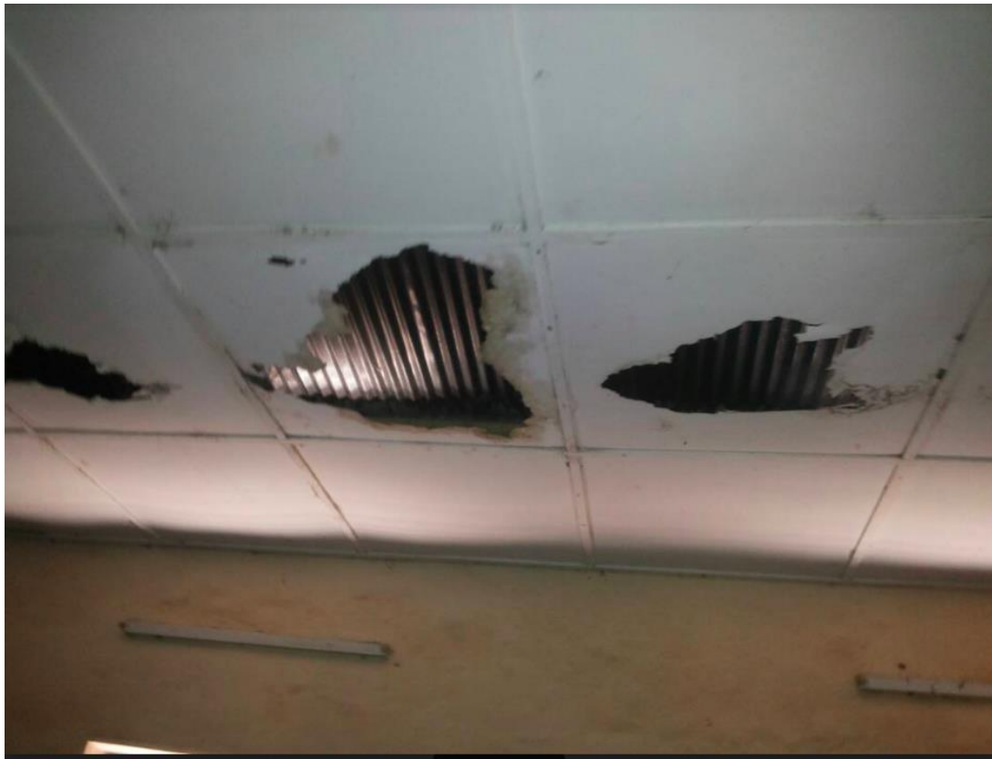
Figure 2 : Toiture d'une salle de cours endommagée