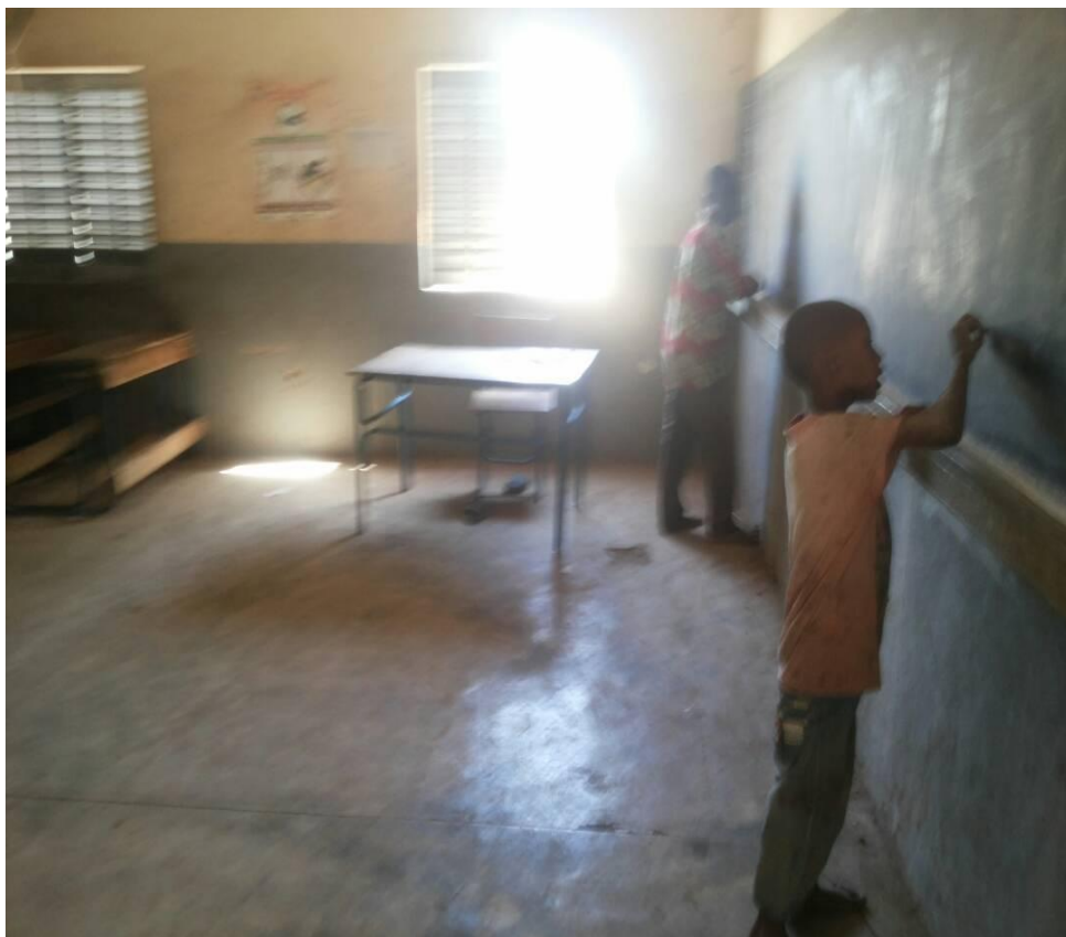
Figure 5 : Image montrant la nécessité d'installer du mobilier supplémentaire